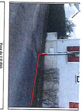
Pose de 2 FI Ø45