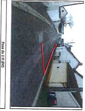
Pose de 2 FI Ø45